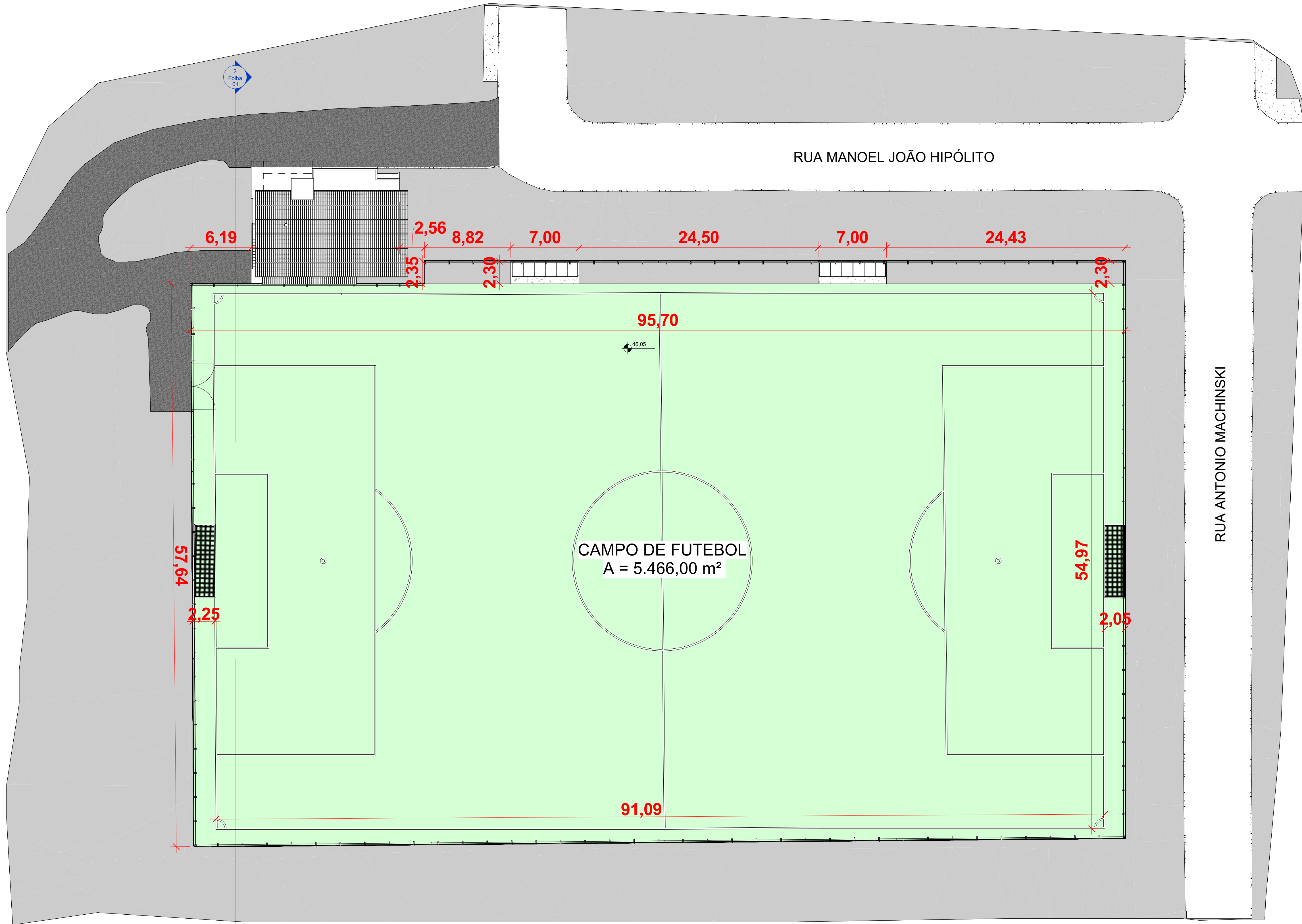
2 Implantação - Cotas ESCALA 1:200